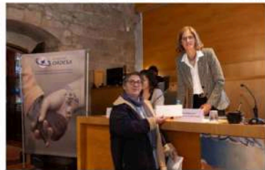
Acto de entrega "XXII Ayudas Fundació Ordesa"