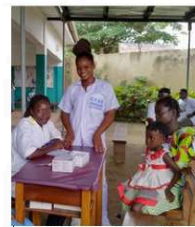
Paneles solares en centro médico-social y casa de acogida. Duékoué (Costa de Marfil) 20.000€