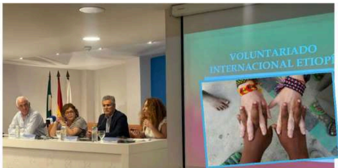
VidesSur en el II Encuentro de Voluntariado, Ayuda Humanitaria y Cooperación Internacional. Excmo. Colegio de Enfermería de Cádiz