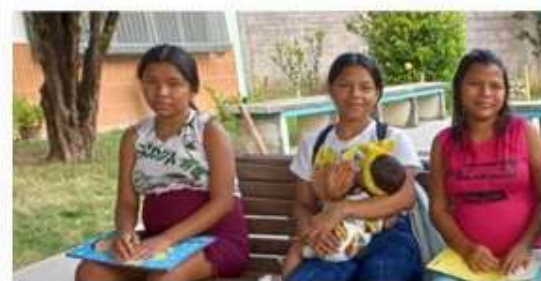
Reconstrucción de Centro de Capacitación Laboral. (Valencia, Venezuela) 13.672,00€