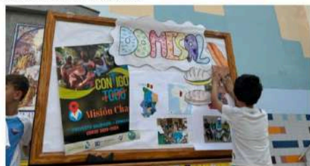
Colegio Ntra. Sra. del Pilar. Las Palmas G.C.