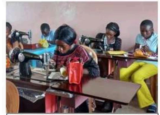
Talleres profesionales para empoderamiento de las jóvenes. Makana (Congo Brazzaville) 15.122,80€