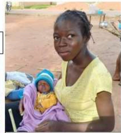
Campaña Domisal "Misión Chad". Educación e igualdad de género. Koumra (Chad) 13.700€