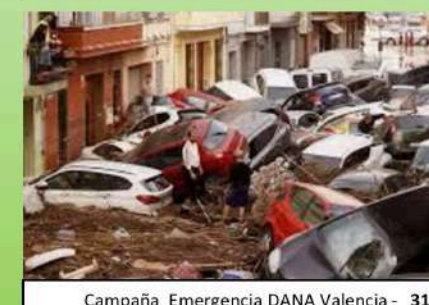
Campaña Emergencia DANA Valencia - 31.721 €