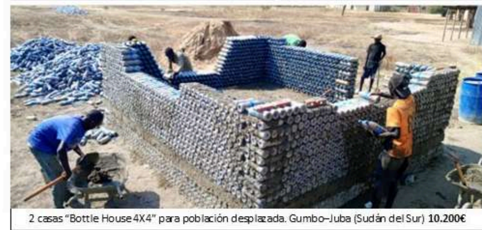
2 casas "Bottle House 4X4" para población desplazada. Gumbo-Juba (Sudán del Sur) 10.200€