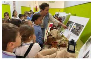
Exposición "Compartiendo Sueños en Tonacatepeque". Salesianas Cádiz

VidesSur es una Asociación sin ánimo de lucro, una Organización No Gubernamental de Cooperación al Desarrollo, con sede social en C/ Espinosa y Cárcel nº 26, 41005-Sevilla, reconocida desde diciembre de 2005. Delegaciones en: Pozoblanco (Córdoba), Cádiz, Marbella (Málaga), Jerez de la Frontera (Cádiz), Tuineje (Fuerteventura) y las Palmas de Gran Canaria. Inscrita en: Registro Nacional de Asociaciones: Grupo 1/Sección 1/Número nacional: 586.346; Registro General de Entidades de Voluntariado de Andalucía, con el número 154; Agencia Andaluza de Cooperación Internacional número 2344 / NERVIÓN / Tomo XXIV/Libro 235/Folio 8 y declarada de Utilidad Pública desde 16/02/2009. Miembro de: Federación de ONGD de Sevilla y de VIDES INTERNACIONAL. Reconocida por: la Consejería para la Igualdad y Bienestar Social de la Junta de Andalucía con el núm. AS/E/5609 y como Entidad de Carácter Social por la Agencia Social para la Agencia Estatal de la Administración Tributaria. Adscrita a la Agencia Española de Cooperación Internacional (AECI) según resolución de fecha de 7 de junio de 2006 y a la Agencia Andaluza de Cooperación Internacional para el Desarrollo (AACID)