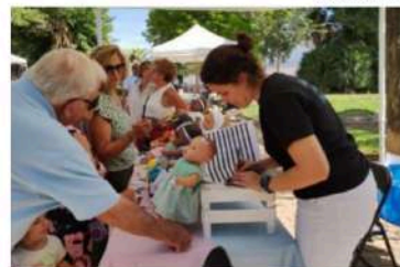
Mercadillo Solidario Mª Auxiliadora. Montilla