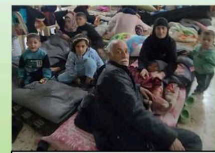
Campaña Emergencia Líbano - 11.932,65 €