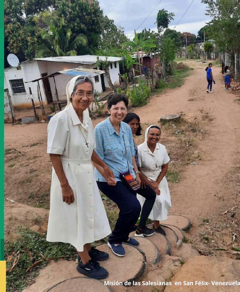
Misión de las Salesianas en San Félix- Venezuela