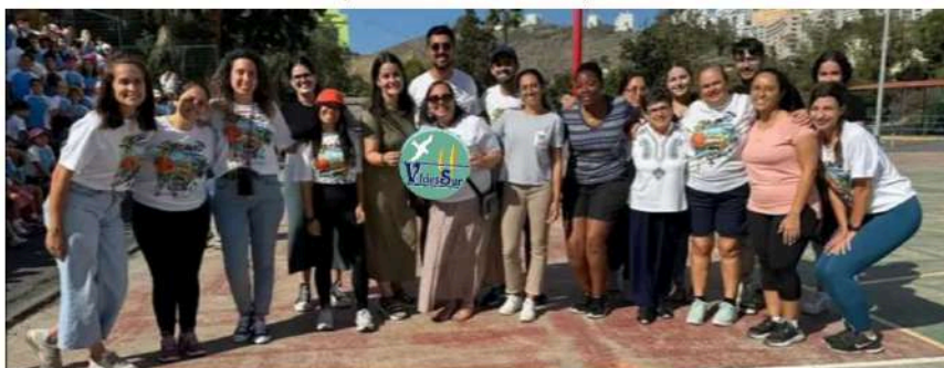
Campaña DOMISAL "Misión Chad". Colegio S. Juan Bosco - Las Palmas de Gran Canaria