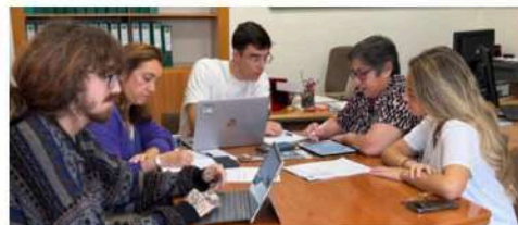
Estudiantes de prácticas en la Oficina de Proyectos de VidesSur