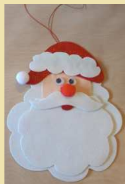
MODELO 7 DONATIVO 4€