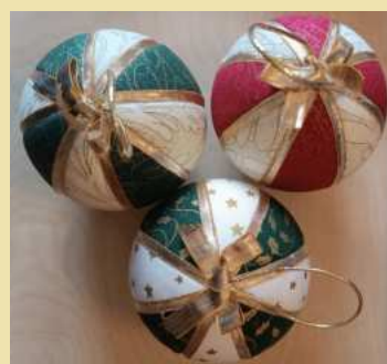
MODELO 4 DONATIVO 5€