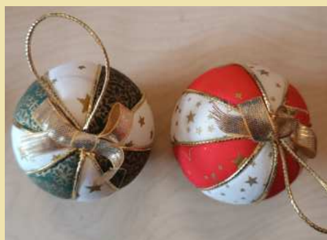
MODELO 2 DONATIVO 3€