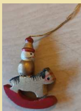
MODELO 8 DONATIVO 2€