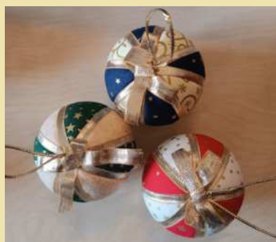
MODELO 1 DONATIVO 3€