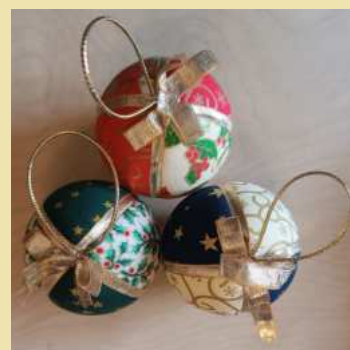
MODELO 3 DONATIVO 3€