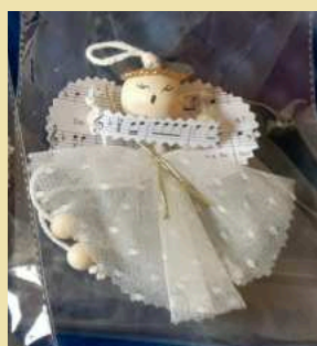
MODELO 5 DONATIVO 6€