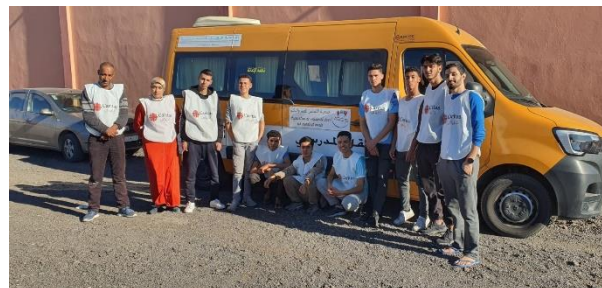
Con voluntarios de la Asociación Solidaridad de Marrakech

Hemos favorecido el trabajo con asociaciones locales que nos permiten involucrar a las poblaciones locales de manera más efectiva y tener información sobre las personas a las que podemos ayudar.