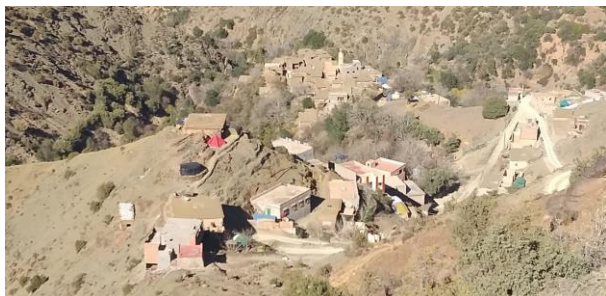
Taouite, en la zona de Imgdal, Asni

La elección de los pueblos y aduare se basó en criterios como el aislamiento, vinculado a la dificultad de acceso a ellos, la magnitud de los daños y el número de víctimas.