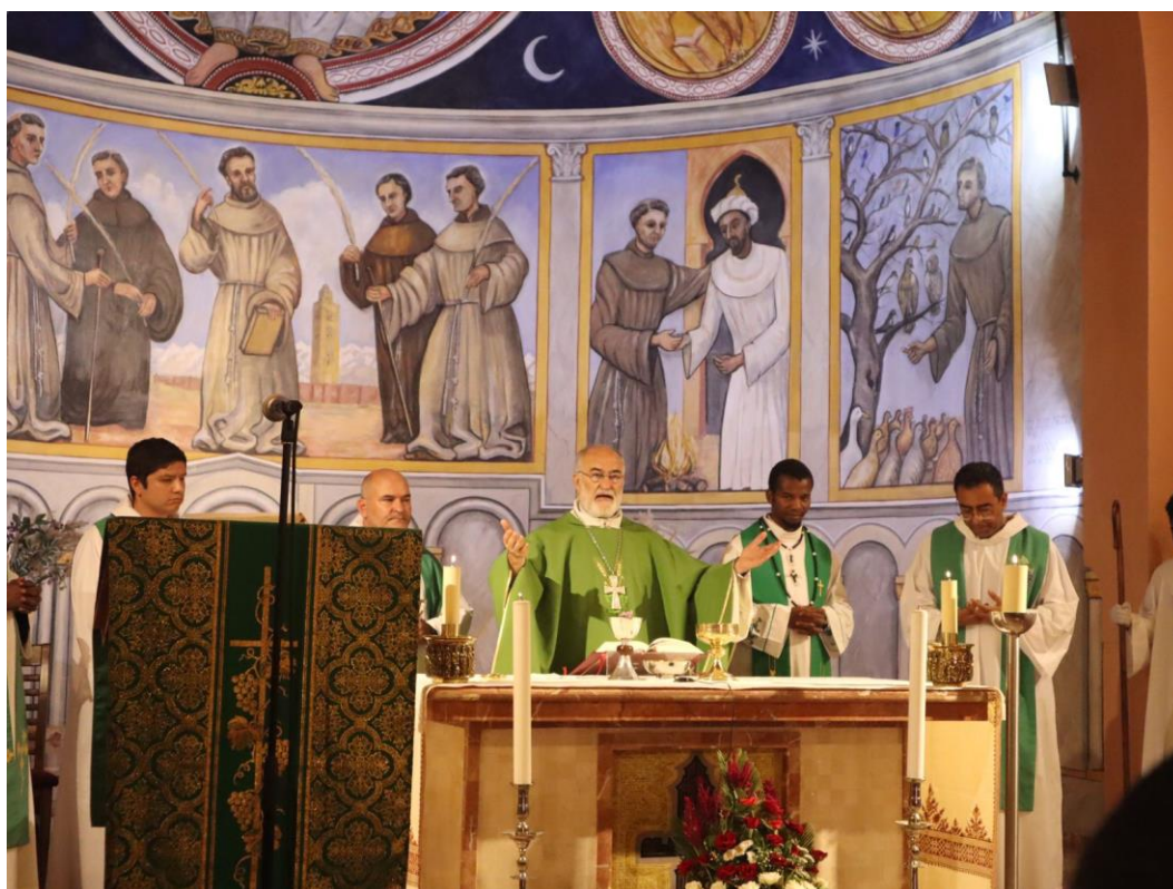
Celebración eucarística presidida por el Card. Cristóbal Romero López, sbd, arzobispo de Rabat Parroquia de los Santos Mártires, Marrakech – 10 de septiembre de 2023