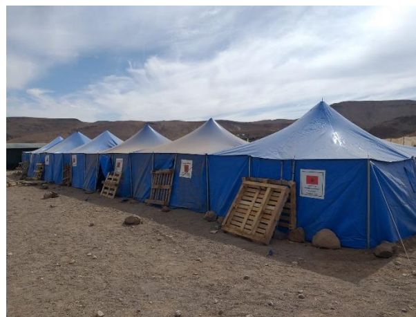
En Ait Ighemoure, Quarzazate

sea lo más adaptada posible a las necesidades reales.