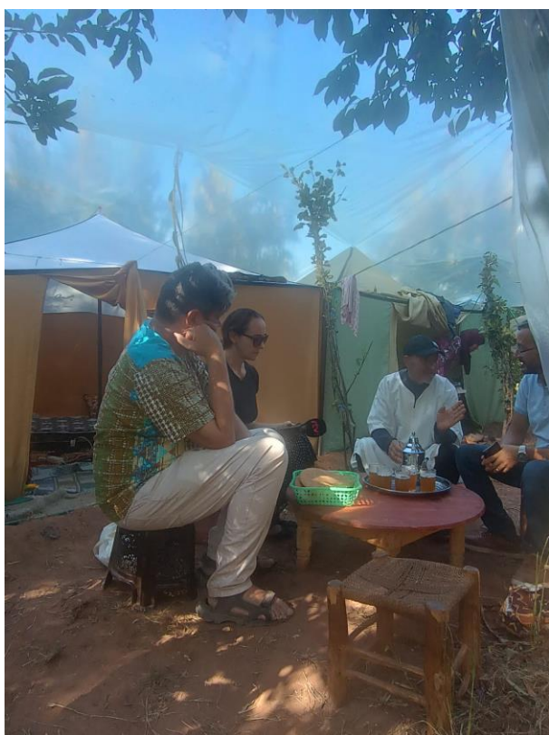
Caritas Rabat y Caritas Eslovaquia en Asni

Los equipos de Cáritas de Rabat y otros visitantes quedaron marcados por la acogida de la población local. La simpatía y la amabilidad de los marroquíes que acababan de ser golpeados tan duramente demostraron ser ilimitadas. Al igual que la solidaridad de los marroquíes en el resto del país, la solidaridad de las víctimas entre sí ha sido ejemplar.