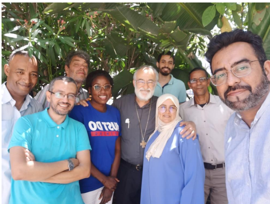
Equipo de la Cáritas Diocesana de Rabat