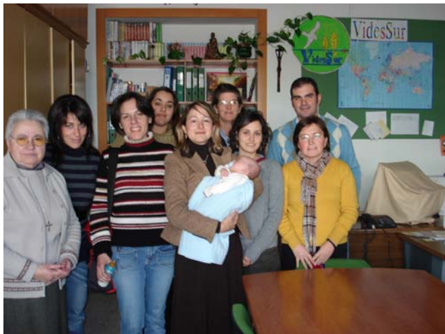
Saludos de los asistentes

Voluntarias de Pozoblanco, Jerez y otros lugares excusaron su ausencia a esta reunión, las esperamos para las próximas ocasiones.